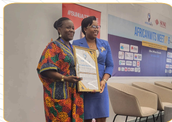
AWARDS LEADERSHIP FÉMININ DANS LES SECTEURS EMERGENTS