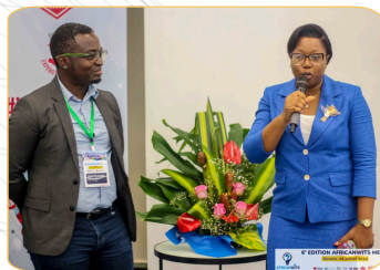
INSTANT PARTENAIRE : IFC CAMEROUN, PMI CAMEROUN, CFAO MOBILITY