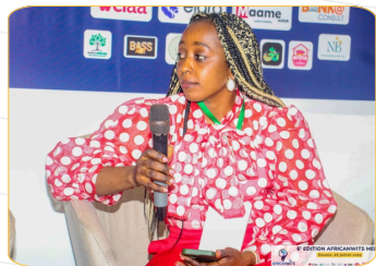
PANEL 3 : FEMMES, ENTREPRENEURIAT VERT ET INVESTISSEMENT DURABLE